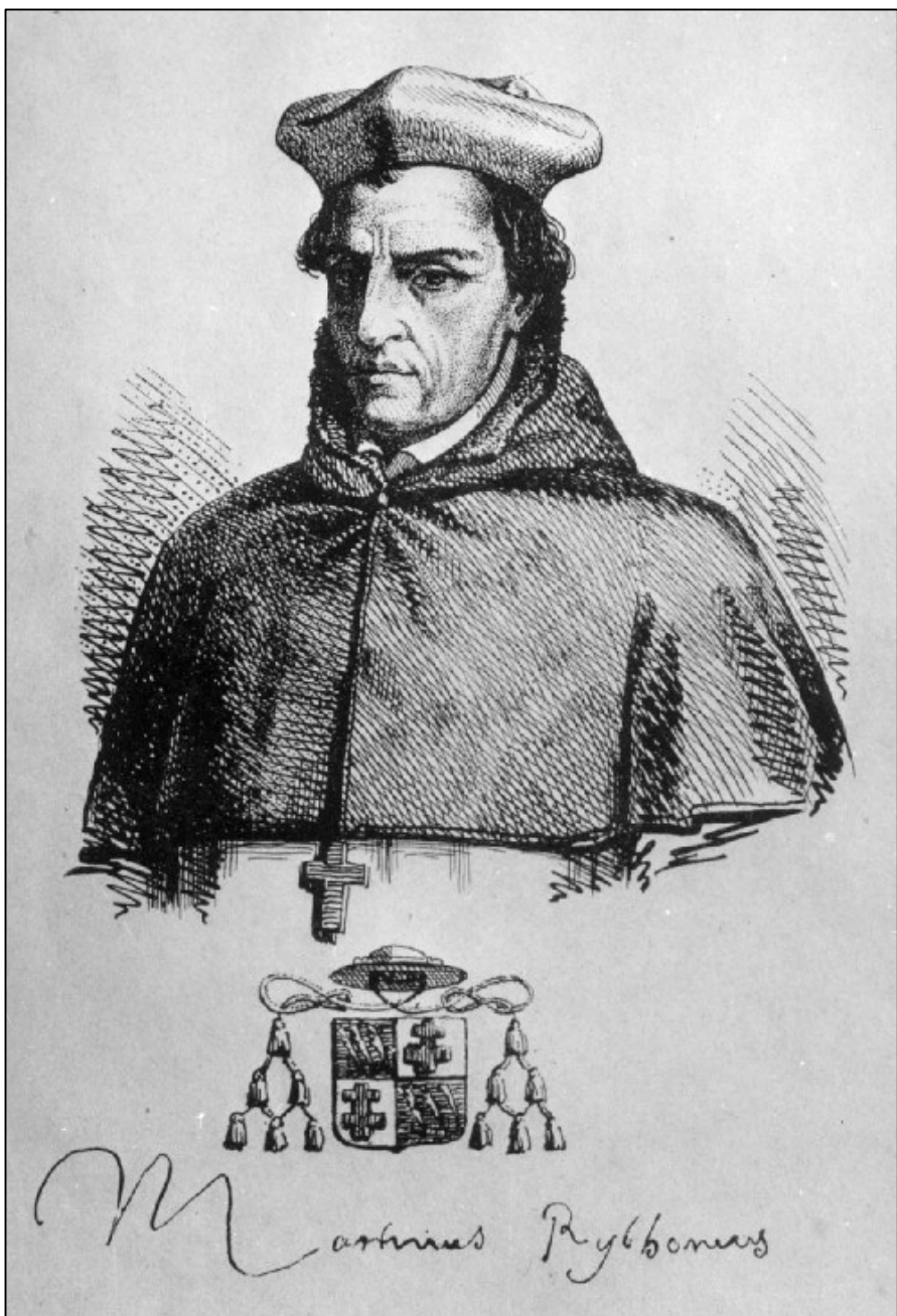
Martinus Rythovius, bisschop van Ieper