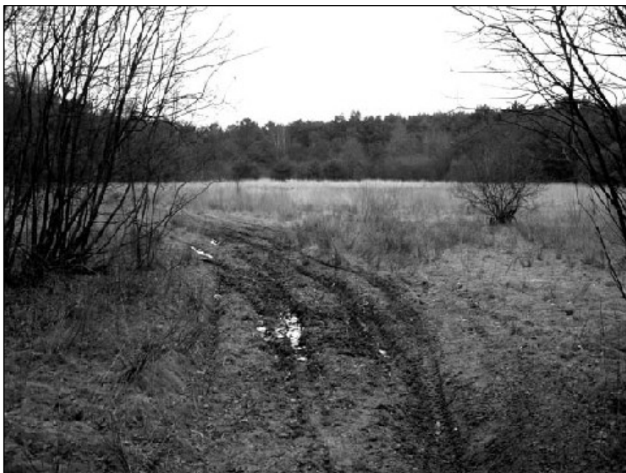
Het Broven opgedroogd en dichtgegroeid januari 2006.

eerste gereformeerde secretaris God[efridus] Wijchmans aangesteld. Al zijne opvolgers tot 1821 waren ook Protestant 80 .