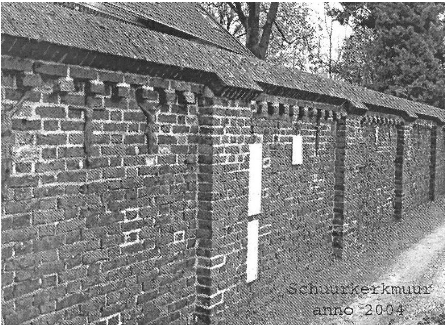
Schuurkerkmuur anno 2004

Behalve het in het Register geschreven Gildereglement van 1488, wordt op een los papier nog eene kopie daarvan, zonder datum bewaard. In dat reglement komen als bepalingen of artikelen vóór, dat iedere gildebroeder bij het optrekken, eene witte roede in de hand vóór het H. Sacrament dragen moest, op de teerdagen o.a. een middagmaaltijd door alle leden gehouden werd, ongehuwde vrouwen niet aangenomen werden of geen lidmaatschap verwierven, enz. Had het gezamenlijke getal teerdagen jaarlijks acht dagen beloopt; men stelde deze in 1783 op vijf dagen.