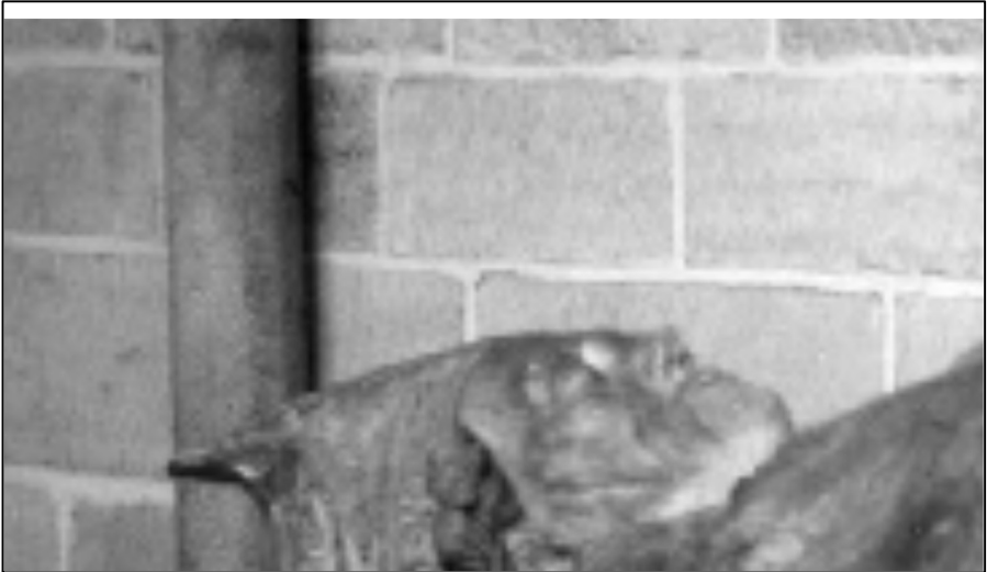
Fragment graftombe in de Sint-Maartenskerk te Ieper (1982).

Hij bevestigt verscheidene twijfelachtige en betwiste punten, zooals de datum der wijding van Rythovius (November 1862) en zijn eenzaam leven na de staking der gevangenschap in zijne diocees; hij wijst het verraad de inneming van de stad Yperen door de Gentenaren in 1570 aan, en toont ons het lichaam van den bisschop, te Yperen van den dag zijner overbrenging, in het koor.