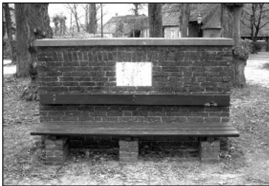
Monument voor Rythovius op Walik

Het ovaal schild is getopt met kroon van ... paarlen, waarvan drie uitsteken. Schildhouders: drie aanzierende leeuwen. Zonder legende. Cachet in rood was. Zie J.Th. de Raedt. Armoiries des Pays-Bas etc. Supplement IV, 411, contenen: Les Comtes et Seigneurs de Brouhoven van Bergeijck. Het zegel enz. als boven.