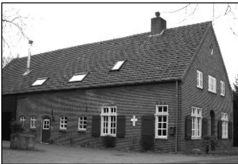
Boerderij op Walik met kruis in de gevel als herinnering aan de geboorteplaats van bisschop Rythovius. Januari 2006.

Men leest slechts van een geneesheer of heelmester die te Riethoven gevestigd of woonachtig is geweest. Deze was meester Henrick Coninx en bezat alhier althans in de eerste helft der zeventiende eeuw een huis, waarvan hij in 1664 nog eigenaar genoemd wordt. Eene Schepenakte van Bergeik van dat jaar betitelt hem als doctor in de medicijnen. In de aangrenzende dorpen scheen des tijds geen docter gevestigd te zijn. 88