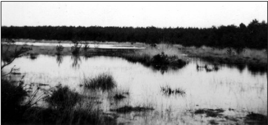
Het Bro(od)ven februari 1953.

Naar de zijde van Eersel en Steensel is de grond hooger dan naar de andere zijden in de onmiddellijke nabijheid van het ven. Deze heide had oudtijds eene veel aanzienlijker uitgestrektheid rondom het Broodven. Sinds eene eeuw zijn er eene menigte bosschen aangelegd. In September 1903 vond men in een heuvel 2 minuten van het Broodven in de richting van Walik eene schier vergane urn.