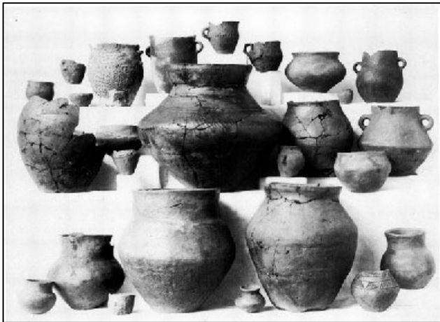
IJzertijdurnen uit het grafveld aan de Keesopperdijk

In de dingbank van Bergeik hadden zitting voor Bergeik 3, voor Riethoven en Westerhoven elk twee Schepenen, Borkel na rato. Na 1648 moesten alle ambtenaren Gereformeerde wezen. Bij gebrek aan zulke, konden in deze dingbank niet alle voor in 1664 vervangen worden (2) soms nog later (3).