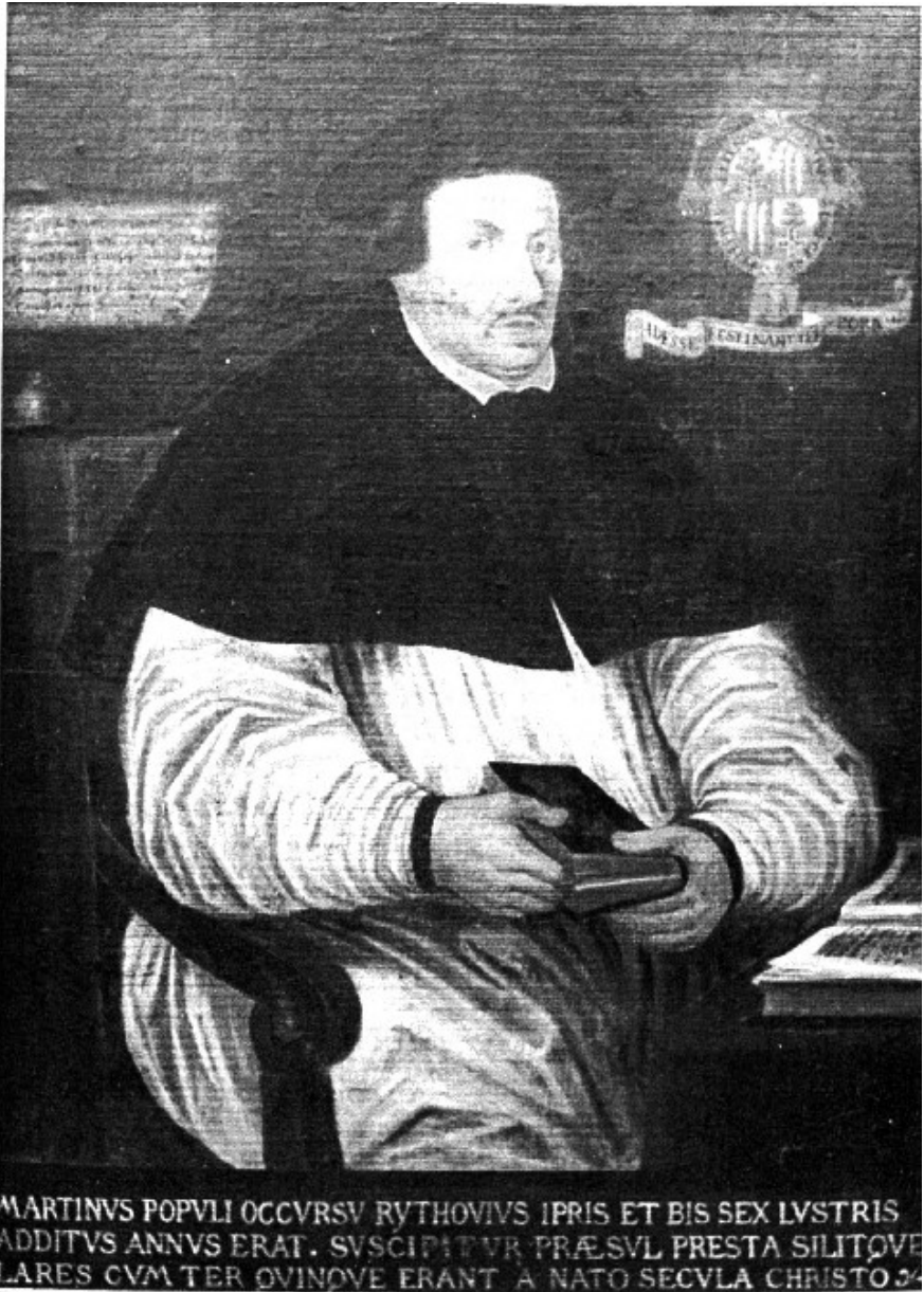
Het Rythovius schilderij in Riethoven