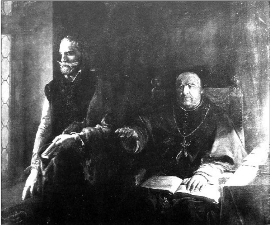
Bisschop Rythovius met graaf Egmont. 'Egmonts letzte Stunde' geschilderd door Louis Gaillait (1848) Nationalgalerie Berlijn, 171 x 205 cm.

De pastoor aanvaardde later het rectoraat der Latijnsche school in het insgelijks vrije Gemert, waar zijn zwager I.A. van Dijk de geneeskunst uitoefende. Men koesterde groote verwachting van dien ijverigen, veel vervolgden priester, die in weinige jaren aan die school haren goeden naam en ouden roem terug gaf. Bijnen 74 stierf in ballingschap 2 October 1768 te Gemert, in den ouderdom van 59 jaren 75 .