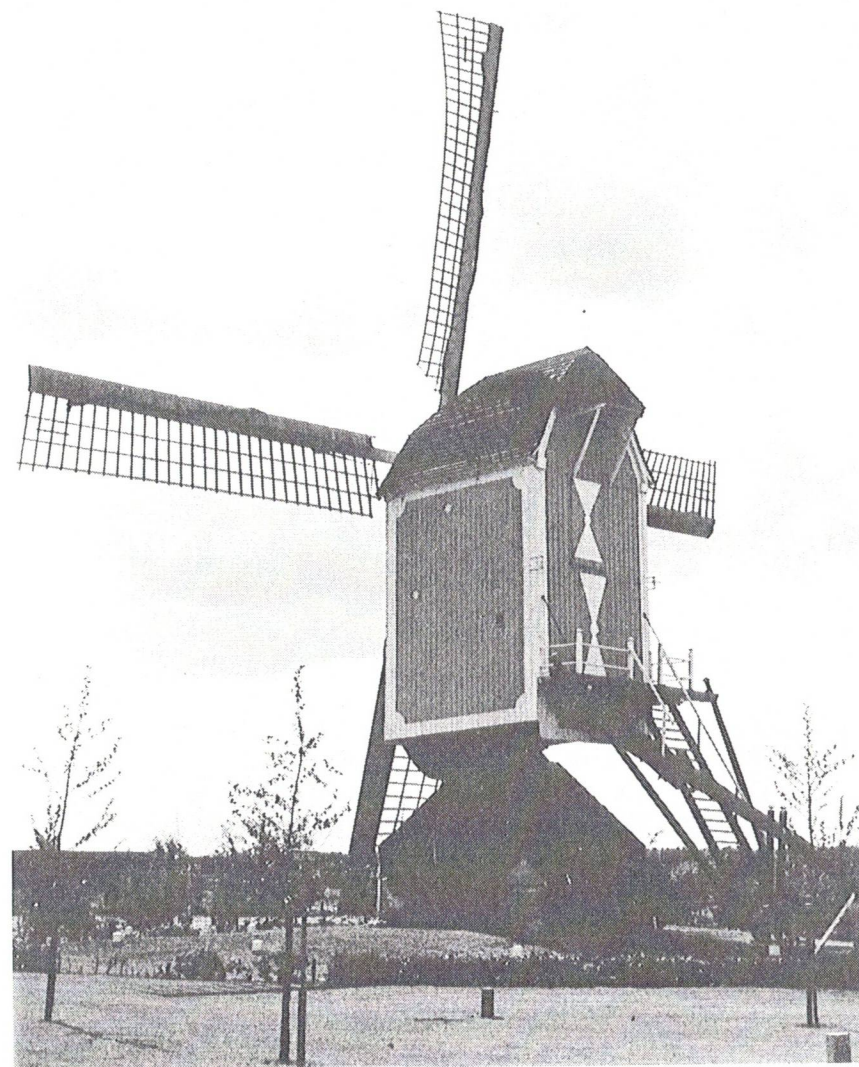
Het is dit jaar precies 100 jaar geleden dat de Bergeijkse standaardmolen door de bliksem flink beschadigd werd. Desondanks staat hij nog altijd overeind.

Als we dit lezen vragen we ons af: hoe is het mogelijk dat er nog molens zijn overgebleven. Wat moeten de molenaars vroeger in angst en beven de onweersbuien hebben afgewacht. Dat molens erg kwetsbaar waren is begrijpelijk omdat ze in onze Kempen tot - zeg maar het midden van onze twintigste eeuw - eenzaam in korenzeeën