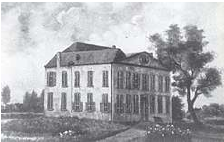
Kasteel Blaarthem, kort voor de brand in 1893

Ook op het gewezen aloud kerkhof te Blaarthem ligt nog de aanzienlijke grafzerk van een der oude adellijke bewoners van het kasteel, waarop dit opschrift: Hier leet begrave Joncker Rudolf va Eyck Heer tot Blaarthoum, Zeelst, Velhove sterf de 7 Mert A o 1580 Ende Jufferou Heylwick Va Berckel sijn Huijs Vrouwe Sterf de 3 October A o 1590. De wapenteekenen van Van Eyck en van Berckel versieren almede dezen zerk, die voortijds boven den grafkelder in het koor der gewezen kerk lag en sedeert 1865 in het midden dezer verlaten begraafplaats naast het Kruis en de grafplaats van pastoor Van Oorscot gevonden wordt.